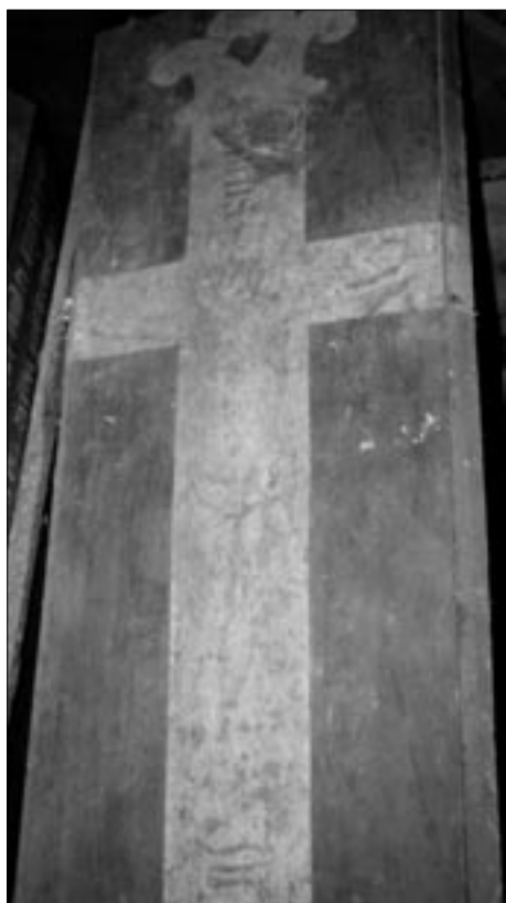
Abb. 3: Deckelplatte mit aufgemaltem Kreuzifix. Der mit schwarzer Farbe gemalte Gekreuzigte ist noch schwach zu erkennen.

in der Gruftkammer fand. Vielmehr zeugt ein Knüppel auf einem Sarg von mutwilligen Tätigkeiten wie Stochern in Bestattungen oder Aufhebeln von Särgen.