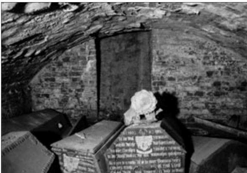
Abb. 1: Blick in das Gruftgewölbe auf die Särge aus dem 17. Jahrhundert.

Das Gewölbe selbst ist eine einfache, Ost-West-ausgerichtete Tonne, im Grundriss nahezu identisch mit dem der Kapelle selbst (Abb. 1). Offensichtliche Schäden am Kalkputz sind Ausblühungen, starke Blasenbildung und großflächiger Ausbruch des Putzes mit seinem Inschriftenprogramm.