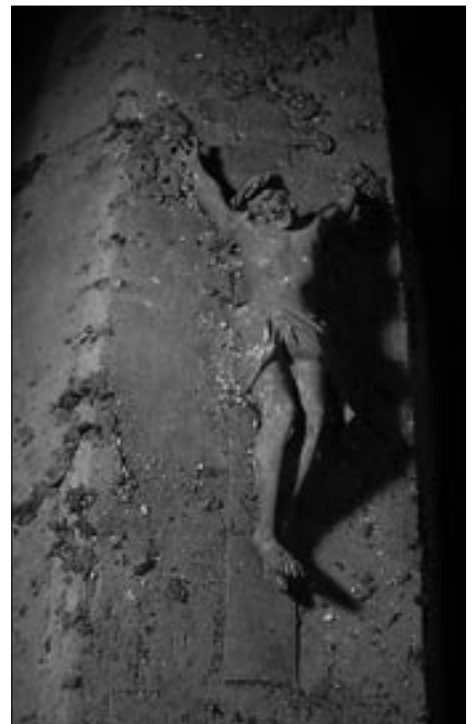
Abb. 4: Kruzifixus auf dem Deckel eines Sarges aus dem 18. Jahrhundert.

Bei keinem der dokumentierten Säрге wurden Füße beobachtet. Sargfüße als Abstandshalter zum Boden sind für eine Gruftbestattung