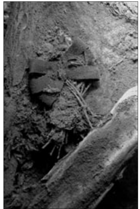
Abb. 6: Reste eines Sträußchens mit schwarzer Seidenschleife auf dem Brustkorb eines Leichnams.

Beigaben konnten in wenigen Fällen beobachtet werden. Auf dem mumifizierten Leichnam in Sarg 10 aus dem Jahre 1659 befinden sich auf der rechten Seite des Brustkorbs die mit einer schwarzen Schleife zusammengebundenen Stängel eines kleinen Sträußchens. Es könnte sich um einen Kräuter- oder Blumenstrauß handeln (Abb. 6). Eine nahezu identische Schleife stammt aus dem ältesten Sarg von 1634. Es handelt sich um eine schwarze, glänzende Seidenschleife, ebenfalls mit sechs Schlaufen, die in der Mitte mit einem schwarzen Faden zusammengebunden sind. Auf der Rückseite haften Reste einer Nadel. Vermutlich wurde auch in diesem Sarg, der leider komplett zerstört vorgefunden wurde, ein kleiner Strauß direkt an der Kleidung der Verstorbenen festgesteckt. Als Beigabe könnte auch ein textiles Objekt in Form eines Hornes anzusprechen sein. Der Fund kann leider keiner Bestattung zugeordnet werden. Das Horn ist ca. 16 cm lang. Seine Vorderseite besteht aus Seide, die mit einer geklöppelten Spitze aus Leinen verziert ist. Die Spitze ist mit Nadeln an der Rückseite befestigt. Die Rückseite besteht aus angerauter Baumwolle. Das Horn selbst ist mit