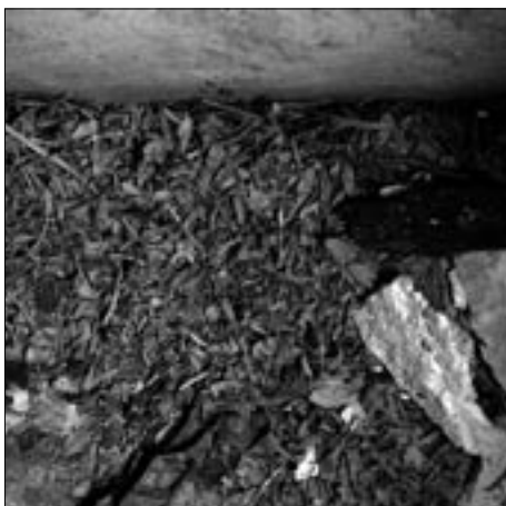
Abb. 5: Hopfenblüten als Sargpolsterung.

Zur Ausstattung der Särge gehörte eine Polsterung, auf die der Leichnam gebettet wurde. Von den insgesamt fünf Särgen aus dem 17. Jahrhundert wurde bei drei Särgen eine Polsterung aus Pflanzen beobachtet. Diese Polsterung ist jetzt noch 1–2 cm dick. Die botanischen Analysen zeigten, dass sie vor allem Stängelfragmente und Blätter der weiblichen Blüten- bzw. Fruchtzapfen des Hopfens enthielten (Abb. 5). Daneben kamen wenige Reste von Roggen, Saathafer, Sandhafer und Gerste darin vor, die aller Wahrscheinlichkeit nach zufällig in die Polsterung gelangten. Die Fruchtdolden des Hopfens verströmen einen leicht aromatischen und schlaffördernden Geruch. Die Polsterung war also nicht nur saugfähig, sondern wirkte auch geruchsdämpfend. Möglicherweise hatte sie auch symbolischen Charakter: die Symbolisierung des Übergangs vom Leben zum ewigen Schlaf. Kräuterpolsterungen oder mit Kräutern angefüllte Särge